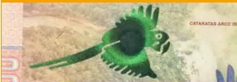
Imagen con cambio de color y movimiento

Impreso con tinta especial, justo en el reverso del billete está un animal conmemorativo que al inclinarlo de izquierda y derecha verá una barra con efecto que cambia su color de oro y verde.